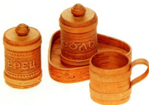
Столовый прибор из бересты радует глаз, а значит — улучшает аппетит. Соль в берестяной солонке никогда не окисляет, а перец не теряет своего аромата.

С незапамятных времен в обиход человека вошли берестяные изделия. В средней полосе России березы растут практически повсеместно, поэтому одно из главных достоинств бересты — ее доступность и распространенность. В Древней Руси бересту применяли для изготовления предметов быта — в каждой из-