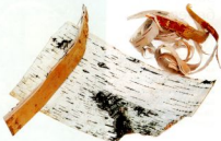
Этого небольшого куска бересты хватит на оформление букета, так как из него получится много тонких ленточек.

Любой природный материал, как правило, покрыт слоем пыли, поэтому бересту следует предварительно вымыть в теплой воде. Однако такой способ очистки хорош, когда есть время на дополнительную сушку и количество бересты небольшое, в противном случае можно обойтись и сухой чистой мягкой тряпкой. Затем береста раскладывается на столе светлой стороной вверх, и все утопления и наплывы срезаются острым ножом или ножницами. Следующий этап обработки — расслаивание. На торцевом надрезе помещается тонкий слой бересты и очень осторожно снимается тупой стороной ножа. Не старайтесь делать слой как можно тоньше — это лишняя трата времени и сил, а береста будет рваться от малейшего прикосновения. Промысловики, плетущие берестяные изделия, чтобы придать бересте дополнительную эластич-